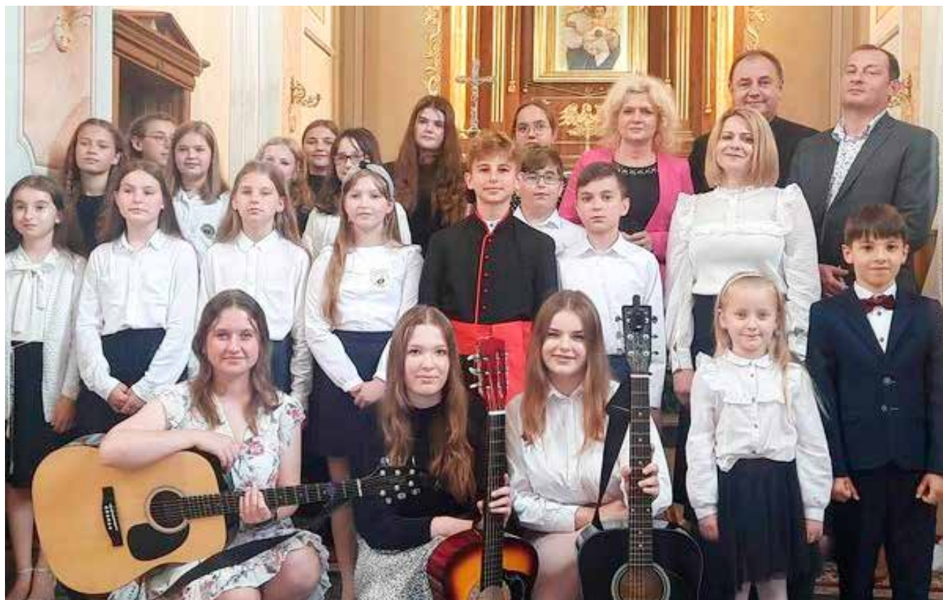
- Święto Patrona Szkoły Podstawowej im. Kardynała Stefana Wyszyńskiego w Manasterzu „Prymas Niezłomny„