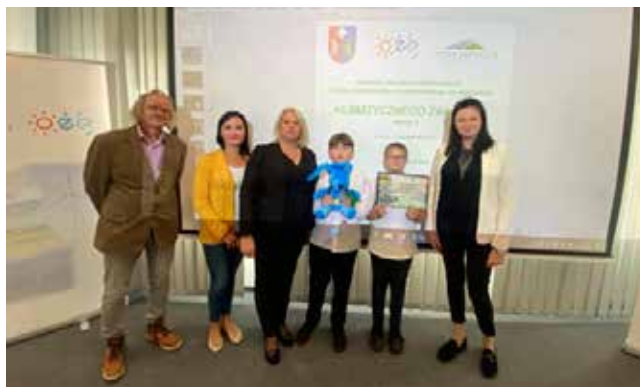
Odbiór nagrody w Urzędzie Marszałkowskim

Uczniowie Szkoły Podstawowej w Wiązownicy zajęli III miejsce w konkursie „Klimatyczny Zakątek 2”, a w nagrodę otrzymali bono o wartości 2 000 zł. Konkurs został zorganizowany przez Samorząd Województwa Podkarpackiego i Stowarzyszenie „EKOSKOP” w Rzeszowie. „Klimatyczny zakątek”, to mała cegiełka uczniów SP w Wiązownicy dołączona do starań mających na celu przeciwdziałanie niekorzystnym zmianom klimatycznym. Rozdanie nagród odbyło się 11.10.2023 r. w Urzędzie Marszałkowskim w Rzeszowie.